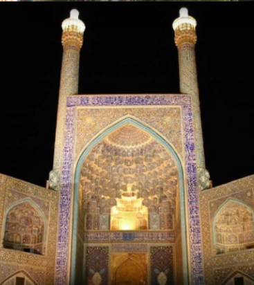
Mezquita del Imán, Isfahán