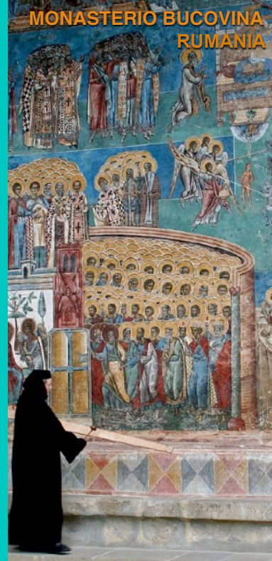
MONASTERIO BUCOVINA RUMANIA