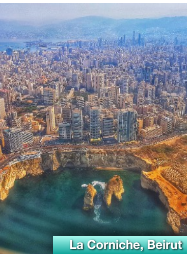
La Corniche, Beirut