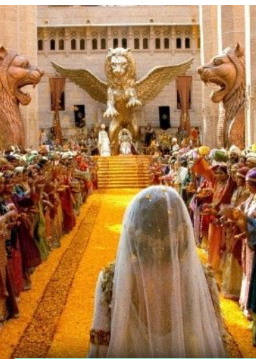
Reina Esther y Mardoqueo, Palacio de Verano, Hamadam