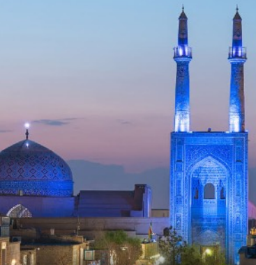
Mezquita Jam-e, Yazd