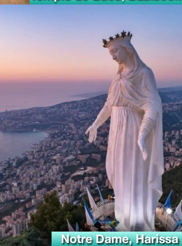
Notre Dame, Harissa