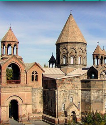
Catedral de Etchmiadzin

Día 9 / MIÉ. 5 JUN. SIGHISOARA - MOLDOVITA - SUCEVITA. Desayuno. Visitamos la ciudad medieval fortificada de Sghisoara, la Torre del Reloj que alberga en su interior el Museo de Historia de la ciudad, la Sala de las Armas Medievales y la Cámara de Tortura. Salimos a la zona de los Monasterios pintados de Bucovina, patrimonio UNESCO (siglos XV – XVI). Visitamos el Monasterio Moldovita, construido durante el reinado de Petru Rares - hijo de Esteban el Grande. Después de pasar los muros defensivos exteriores, de 5 mts. de altura y más de 1 m. de grosor, en su Iglesia de la Anunciación del s. XV veremos el impresionante mural del asedio de Constantinopla, donde se muestra los cristianos bizantinos haciendo retroceder a los infieles con arcos, cañones y la intercesión de los milagrosos iconos. Continuamos al Monasterio Sucevita conruído alrededor de la Iglesia de la Resurrección, que tiene el mayor número de imágenes bíblicas, son obras maestras del arte bizantino, únicas en su género en Europa. Sus pinturas ejecutadas en todas las fachadas son excelsas. La composición extraordinaria, la elegancia de los personajes y la armonía de los colores de los frescos sintonizan perfectamente con el paisaje circundante. Destaca la representación de la Escala Espiritual de San Juan Climaco el santo ermitaño del monasterio de Santa Catalina en el Sinaí. CENA OPCIONAL.