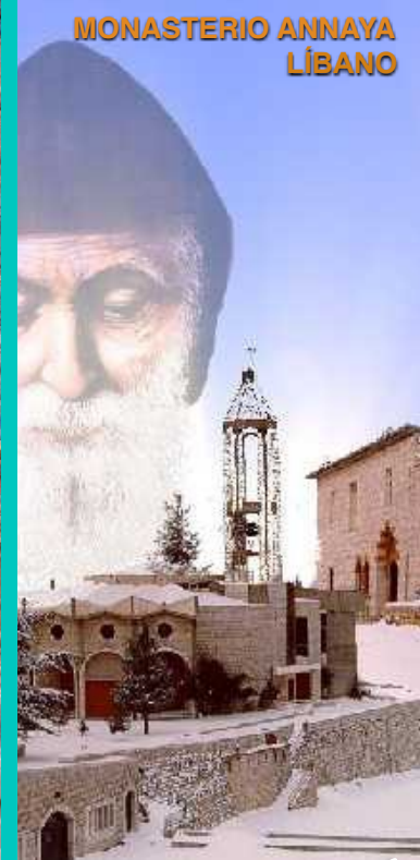
MONASTERIO ANNAYA LÍBANO