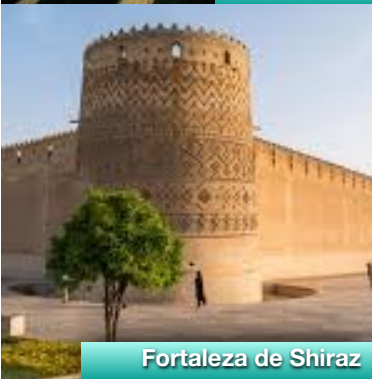
Fortaleza de Shiraz

Desayuno y visita de la ciudad pasando por los rascacielos y los palacios de los Jeques de los Emiratos, tendremos un tiempo libre para comer en el Medina Souk desde donde tendremos estupendas vistas del hotel 7 estrellas Burj el Arab. Por la tarde haremos un safari en vehículos 4x4 por el Desierto de Arabia, tras la emocionante aventura tendremos tiempo de ver el atardecer. Los cambios del color de la arena y de las sombras de las dunas harán que este momento sea mágico. La CENA de despedida será una barbacoa bajo las estrellas donde podrán probar diferentes tipos de carne, aperitivos, ensaladas y dulces típicos de la región. El punto final lo marcarán los diferentes espectáculos folklóricos, entre los que se incluye la famosa danza del