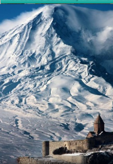
Monte Ararat y Khor Virap