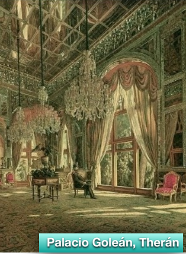
Palacio Goleán, Therán