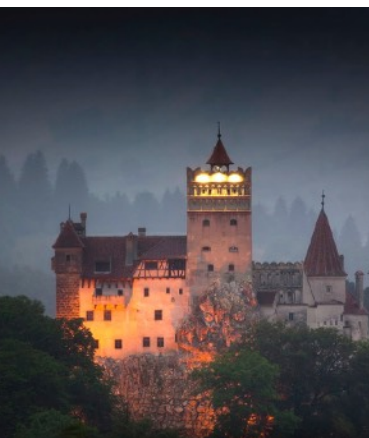
Castillo de Drácula, Bran Rumania