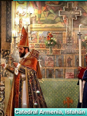
Catedral Armenia, Isfahán

Desayuno. Nos encontramos en la ciudad mas bella del país conocida como "la joya de Persia" en ella podremos admirar magníficos monumentos Patrimonio de la Humanidad que