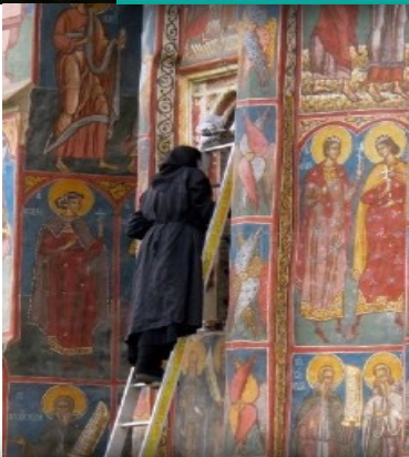
Monasterio Sucevita, Rumania