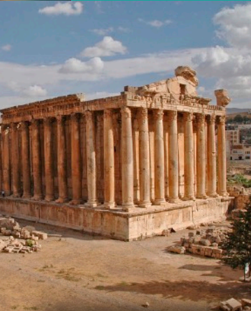
Templo de Baco, Baalbek